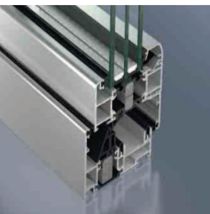
Schüco ASS 80 FD Schüco ASS 80 FD

Aluminium-Faltschiebesystem Aluminium folding/sliding system