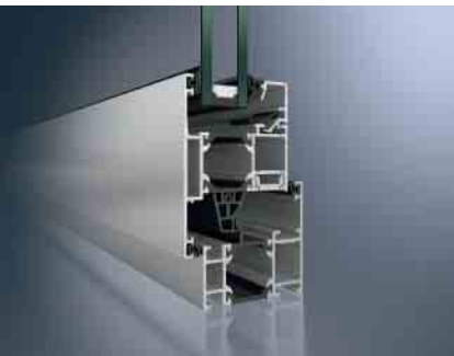
Schüco Fenster AWS 60, nach außen öffnend Schüco Window AWS 60, outward-opening