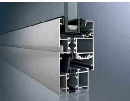
Schüco Fenster AWS 50 Schüco Window AWS 50