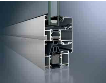
Schüco Fenster AWS 60 Schüco Window AWS 60