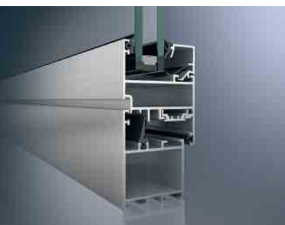
Schüco Fenster AWS 50.NI Schüco Window AWS 50.NI

Schüco Fenster bieten für jeden Markt die richtige Kombination aus Wärmedämmung und geprüfter Systemtechnik.