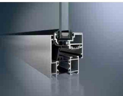
Schüco Fenster AWS 60 BS Schüco Window AWS 60 BS

Schüco hat mit der Fenstergeneration AWS (Aluminium Window System) ein System für alle Anforderungen geschaffen. Funktionale Vorteile verbinden sich mit architektonischen und gestalterischen Aspekten. Vorzüge wie gute Wärmedämmung vereinen sich mit geringen Bautiefen und schlanken Ansichtsbreiten.